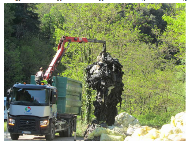
Rechargement de films d'enrubannage sur le site de St Sauveur de Montagut

Au-delà des chiffres, les consignes de tri et de conditionnement ont été globalement bien respectées. Les conditions très ventées de début avril ont confirmé l'importance de bien ficeler les films d'enrubannage ou de les mettre en saches pour limiter les envois.